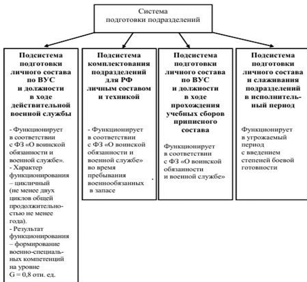
Рисунок 2 – Структурная схема системы подготовки подразделений для резервных формирований

Для определения основного противоречия в этой области знаний необходимо провести анализ процесса функционирования всей системы подготовки. В целом система включает несколько подсистем, которые должны функционировать не только в ходе угрожаемого периода в предвидении введения в действие плана применения при ЧО, но и в мирное время. Структурная схема элементов (подсистем) системы подготовки подразделений для резервных формирований представлена на рисунке 2.