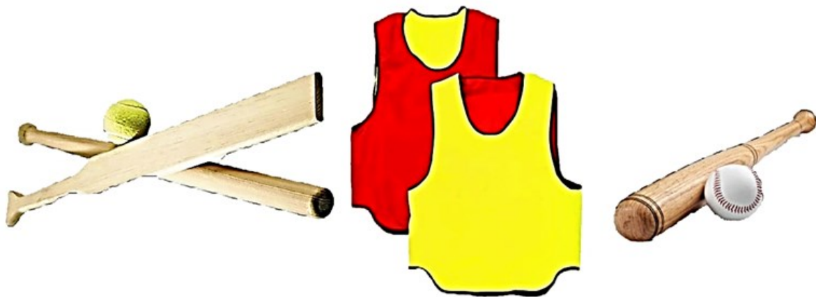
Рисунок 5 – Инвентарь для игры в классическую Русскую лапту: бита (лапта), мяч, манишки

одного цвета (для одной из команд) или манишки двух цветов для каждой команды (рисунок 5).