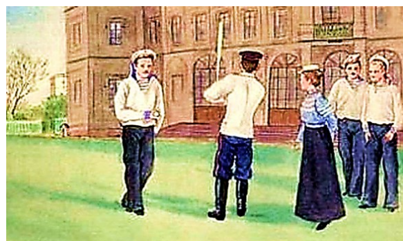
Рисунок 2 – Русские матросы играют в лапту

В первые годы советской власти после окончания Гражданской войны решением председателя Высшего совета физической культуры РСФСР Н. И. Подвойского русская лапта была включена в систему физической подготовки в Красной Армии.