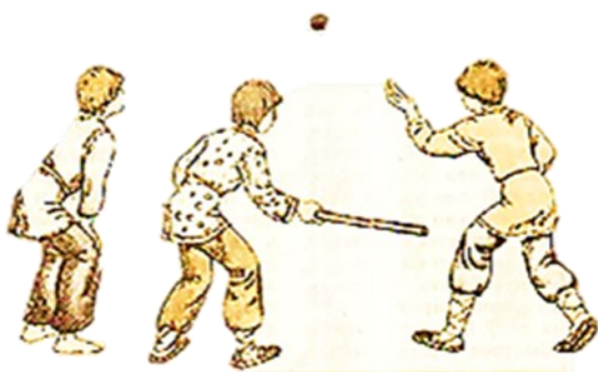
Рисунок 1 – Игра в лапту на Руси

Русская лапта была одной из самых популярных национальных славянских забав, ни один праздник, ни одно народное гулянье не проходили без состязаний в лапту (рисунок 1).