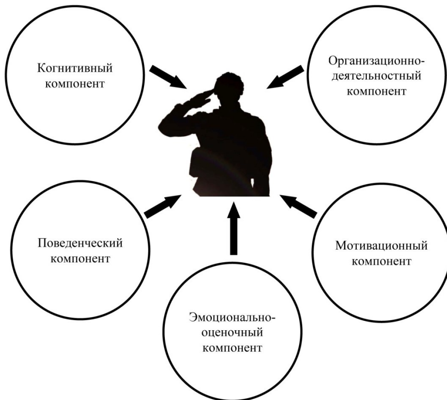
Рисунок 2 – Структура профессиональной Я-концепции будущего офицера войск национальной гвардии Российской Федерации

Структура профессиональной Я-концепцией будущего офицера войск национальной гвардии Российской Федерации представлена на рисунке 2.