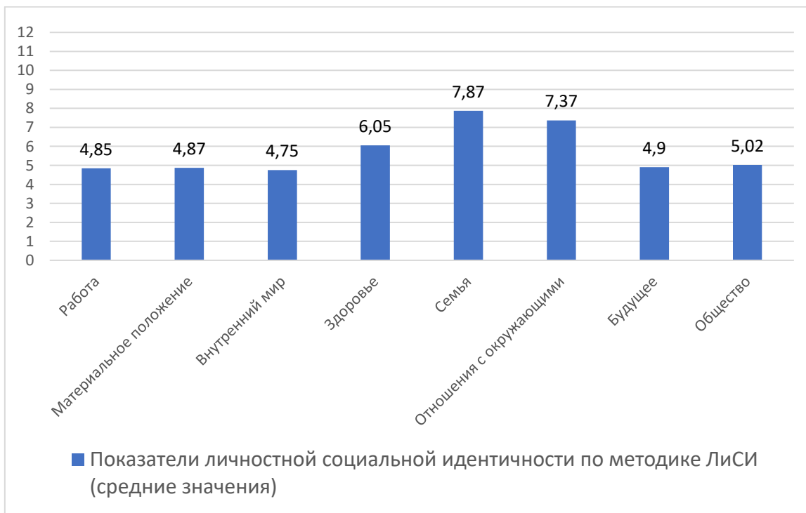
Рисунок 2 – Показатели личностной и социальной идентичности по методике ЛиСИ (средние значения)

«общество, в котором я живу». В рамках исследования полученные данные показывают, что именно эти сферы являются, с одной стороны, ведущими и определяющими жизненную концепцию личности в среднем возрасте, и в то же время считаются наиболее уязвимыми и подверженным кризисным проявлениям.