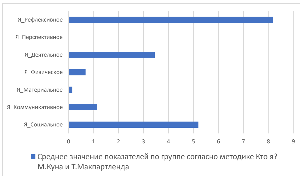
Рисунок 3 – Среднее значение показателей по группе согласно методике «Кто я?» М. Куна и Т. Макпартленда

С целью изучения содержательных характеристик «образа Я» респондентов применялась методика М. Куна – Т. Макпартленда «Кто Я?». Отвечая на вопрос «Кто Я?», респонденты указывали роли и характеристики-определения, с которыми они себя соотносят, идентифицируют, то есть с социальным статусом и теми чертами, которые, по их мнению, характеризуют личностные особенности. Переживание кризиса идентичности определенным образом сказывается на том, какие характеристики человек использует при описании себя.