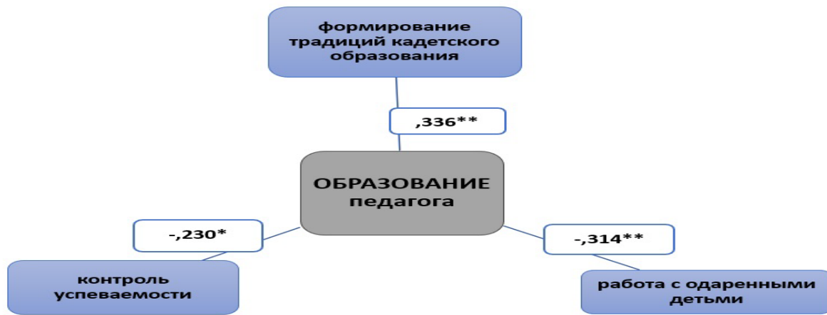
Рисунок 2 – Корреляционная зависимость высшего образования педагогов и выявленных дефицитов