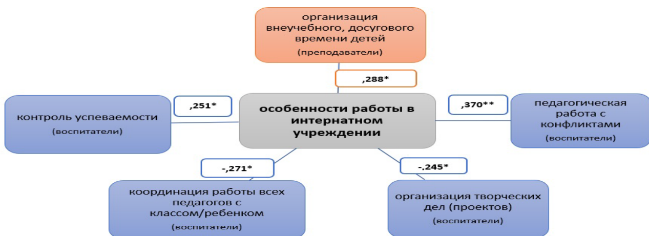
Рисунок 3 – Корреляционная зависимость показателя «Особенности работы в интернатном учреждении» от выявленных дефицитов педагогов

методической компетенцией «контролем успеваемости ( r = 0,251^* , p \leq 0,05 )» и с психологической компетенцией «особенности работы в конфликтной ситуации ( r = 0,370^{**} , p \leq 0,01 )»; отрицательно коррелируют с показателем организационной компетенции «координация работы всех педагогов с данным классом и/или конкретным ребенком ( r = -0,271^* , p \leq 0,05 )» и с показателем исследовательской компетенции «организация творческих дел (проектов) ( r = -0,245^* , p \leq 0,05 )». Для преподавателей показатель «особенности работы в интернатном учреждении» коррелирует с показателем «организация досугового времени детей ( r = 0,288^* , p \leq 0,05 )» (рисунок 3).