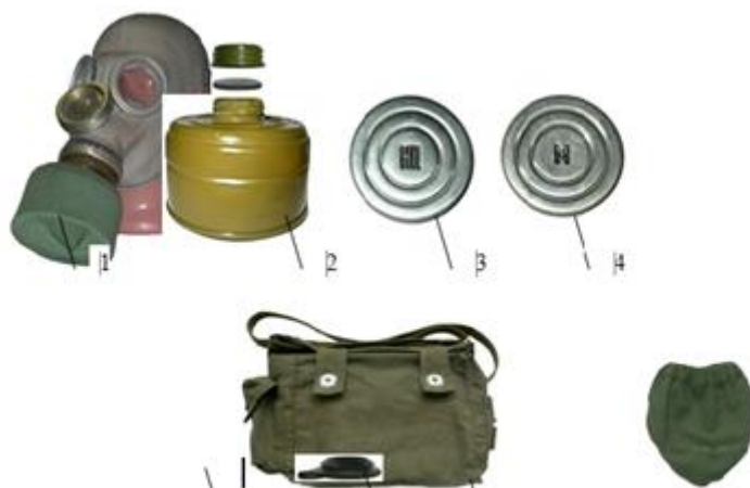
1 – шлем-маска ШМ-66; 2 – фильтрующе-поглощающая коробка ЕО-62К; 3 – не запотевающие пленки; 4 – мембраны переговорного устройства для ШМ-66; 5 – сумка; 6 – заглушка ФПК; 7 – чехол ФПК